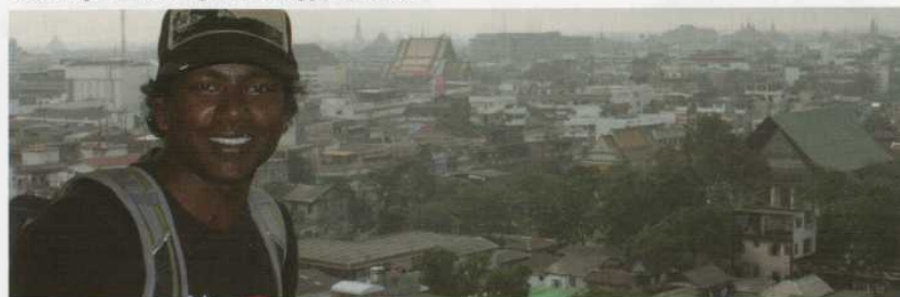
Här är jag i Thailand och kollar ut över Bangkok